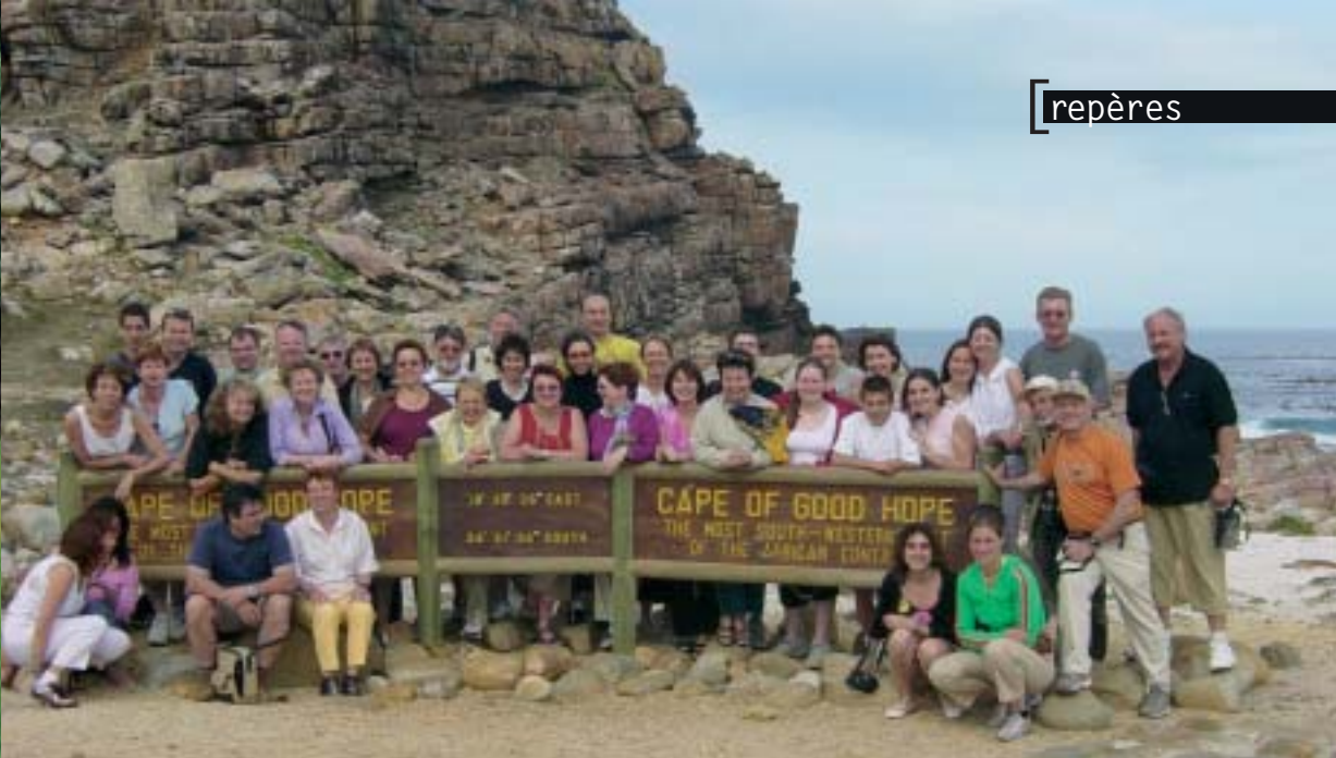
Groupe 2 - Cap Bonne Espérance, Afrique du Sud - 30 avril 2004