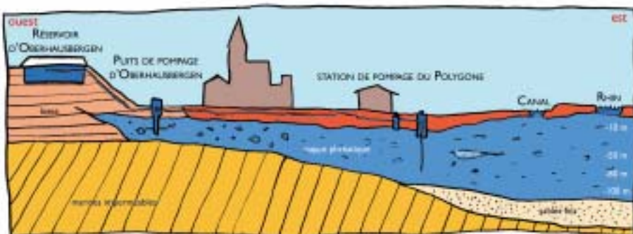
Dessin réalisé d'après les données du Secrétariat permanent pour la prévention des pollutions industrielles (SPPPI).