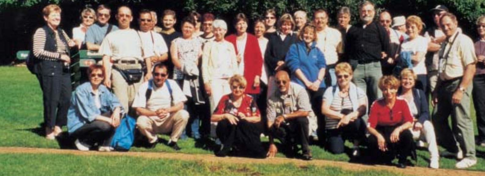
Groupe 1 - Afrique du Sud dans les Jardins de Kirstenbosch - 21 avril 2004