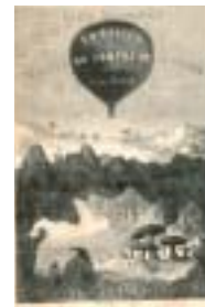
Illustrations des romans de Jules Verne.

Les romans de science-fiction parlent-ils de la science du futur ou de fictions scientifiques? Philippe Clermont*, spécialiste de ce genre littéraire, s'intéresse aux usages que les auteurs font des théories scientifiques. Pour lui, les écrivains s'y intéressent plus comme matériau ou ingrédient d'un récit que pour ses théories proprement dites.