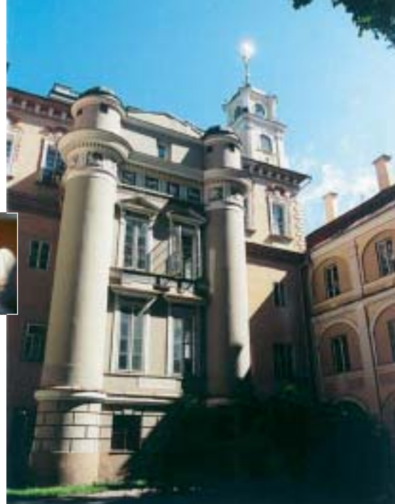
L'Observatoire de Vilnius

C'est fait : l'Europe s'est élargie. 25 pays et 455 millions de personnes font aujourd'hui partie de l'Union européenne (UE). Loin des grands discours politiques, des étudiants des pays baltes en résidence à l'ULP évoquent leurs attentes et leurs espoirs.